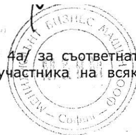
Таблица за ценово предложение по артикули /Образец № 4а/ за съответната обособена позиция, попълнено на всеки ред, подписано от участника на всяка страница и подпечатано.